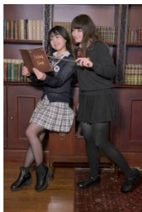
▲Year Book Photo