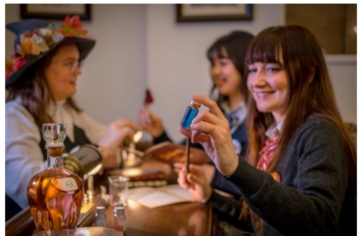
▲レッスンイメージ